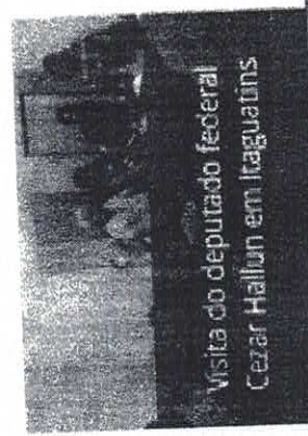
Visita do deputado federal Cezar Hallum em Itaguatins