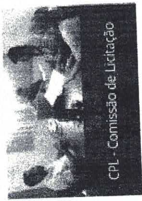
CPL - Comissão de Licitação